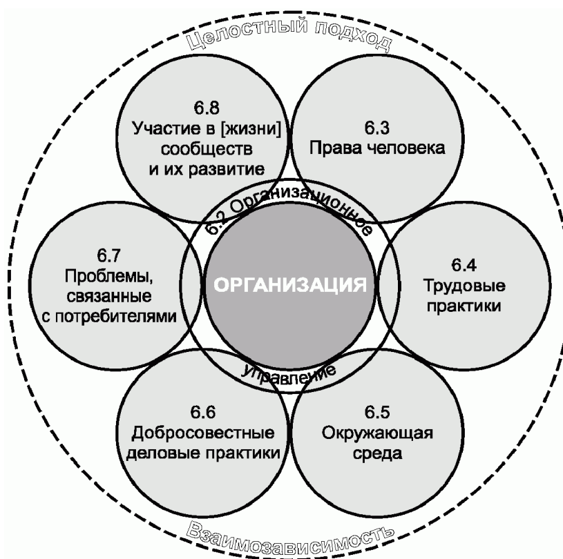
Рисунок 3. Семь основных тем

Экономические аспекты так же, как аспекты, относящиеся к здоровью и безопасности и цепочке создания [добавленной] стоимости, охватываются в рамках семи основных тем там, где это применимо. Также учитываются различия в том, каким образом мужчины и женщины могут быть затронуты каждой из семи основных тем.