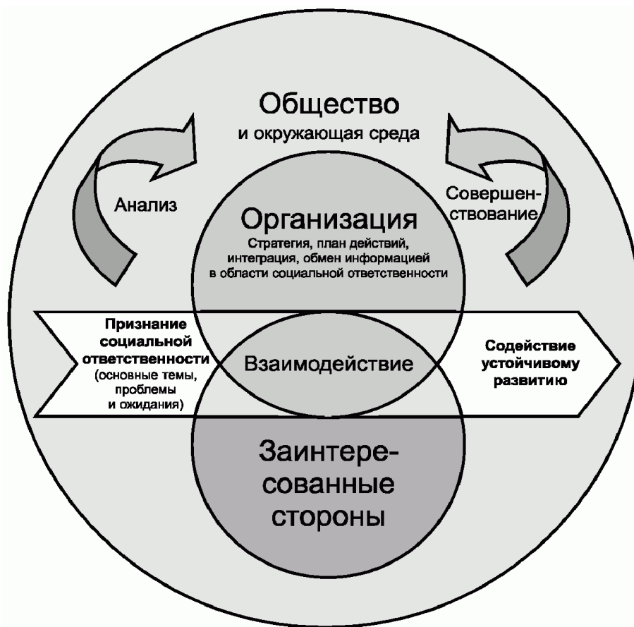
Рисунок 4. Сквозная интеграция социальной ответственности в организации