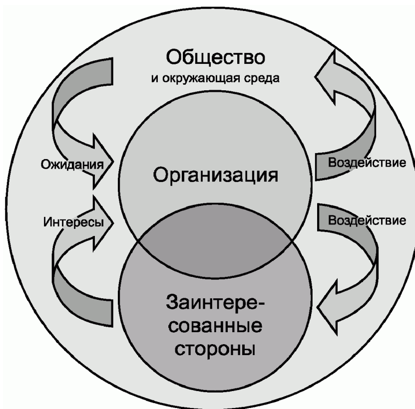
Рисунок 2. Взаимосвязь между организацией, ее заинтересованными сторонами и обществом

При признании своей социальной ответственности организации будет необходимо учитывать все три взаимосвязи. Организация, ее заинтересованные стороны и общество, вероятно, будут иметь различные взгляды из-за того, что их цели могут не совпадать. Следует признавать, что частные лица и организации могут иметь многие и разнообразные интересы, на которые могут повлиять решения и деятельность организации.